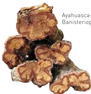
Ayahuasca-Liane Banisteriopsis Caapi

Ayahuasca (Peru), Yagé (Kolumbien), Natem (Ecuador), Abuelita (Grossmutter) sind nur einige Namen, die man diesem Gebräu aus zwei Pflanzen gibt. Dieser Trank besteht aus der Ayahuasca-Liane ( Banisteriopsis Caapi ) und den Blättern eines wilden Kaffeestrauches bzw. Chacruna ( Psychotria viridis ), und wird in gewissen Stämmen schon mehr als 2500 Jahre als Heilmittel eingesetzt. Chacruna enthält dabei den Wirkstoff DMT ( N,N-dimethyltryptamin ) und die Liane die MAOI's ( MonoAminoOxidaseInhibitoren / Harmala ), welche erst so den gewünschten Effekt erzielen können. Denn ohne die Liane würde das DMT-Molekül schon vor Eintritt in den Kreislauf abgebaut. Die Hemmer umschliessen diesen Wirkstoff dabei und lassen ihn so über die Blutbahn ins Gehirn wandern. DMT ist ein natürlicher Stoff, der überall in der Natur vorkommt und sogar von uns Menschen in der Leber produziert wird; nebst den bewusstseinsweiternden Effekten hat diese Substanz noch weitere wichtige Eigenschaften. In klinischen Studien wurde festgestellt, dass DMT zum einen die Funktion hat, die Zellen zu schützen (z.B. bei einem Unfall), und neue Verknüpfungen in den einzelnen Gehirnregionen herstellt. Jedes Lebewesen und jede Pflanze auf diesem Planeten produziert dieses Molekül in sich; ein weiterer Grund wieso es das Geistesmolekül genannt wird. Die Studien laufen dazu noch, ob dieser Stoff eine wichtige Rolle in den Träumen und in der Zirbeldrüse spielt.