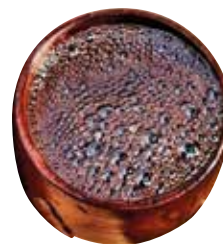
Ayahuasca und Chacruna zur Herstellung des Getränkes