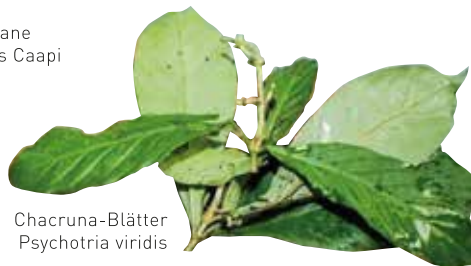
Chacruna-Blätter Psychotria viridis