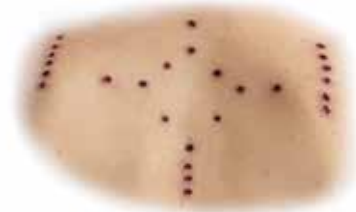
Beispiel von Kambô-Punkten auf dem Rücken und dem Oberarm

Tipp! Samle die getrockneten und abgefallenen Punkte ein, damit du sie später oder bei einer nächsten Zeremonie dem Feuer übergeben kannst.