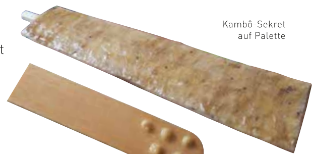
Kambô-Sekret auf Palette

Nachdem die Wirkung der Medizin vorüber ist, werden die trockenen Punkte entfernt und auf die offenen Hautstellen wird ein Mittel appliziert. Entweder flüssiges Drachenblut oder Tepezcohuite-Pulver. Dies wird deine offene Wunde verschliessen, desinfiziert zusätzlich die Stelle und nachdem es eingetrocknet ist, wird deine Haut von selbst eine Kruste erstellen.