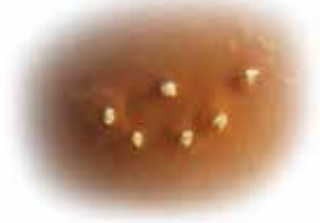
Kambô-Punkte an der offenen Hautstelle