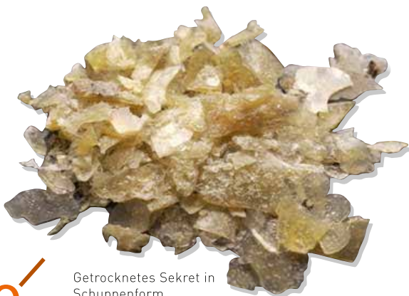
Getrocknetes Sekret in Schuppenform

Bufo Alvarius ist keine klassische psychedelische Medizin und wird häufig auch als Entheogen (in, innerhalb und Gott; vom Altgriechischem abgeleitet) bezeichnet. Betitelt wurde 5-MeO-DMT auch als das Gottmolekül, während DMT als das Geistesmolekül dargestellt wird. Trotz Studien und Geschichten konnte nie bewiesen werden, dass die indigenen Stämme der Seri und Yaqui in Sonora damit gearbeitet hatten. Die Symbolik von Fröschen und Kröten ist allerdings in den nativen Stämmen von Nordamerika weit verbreitet, wobei dies aber mit dem Mond und dem Zyklus in Verbindung gebracht wird. Die Medizin wurde erst in den 60er-Jahren durch einen Psychonauten anhand einem Selbstversuch entdeckt und hat sich in diversen Anwendungsfeldern etabliert.