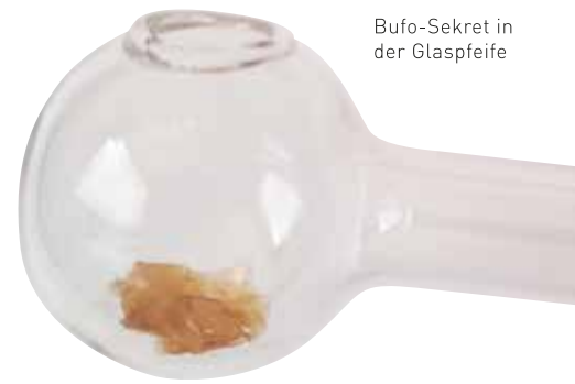
Bufo-Sekret in der Glaspfeife

Es ist die einzige Art, wie diese Medizin eingenommen werden kann. Oral funktioniert es nicht, da das Molekül vorher abgebaut wird, bevor es über die Bluthirnschranke aufgenommen werden kann. DMT braucht immer einen Hemmer, dass es im Gehirn seine Wirkung entfalten kann, was bei 5-MeO-DMT aber sehr risikobehaftet ist; später mehr dazu. Der direkte Weg ins Blut und ins Gehirn findet somit über die Lunge statt.